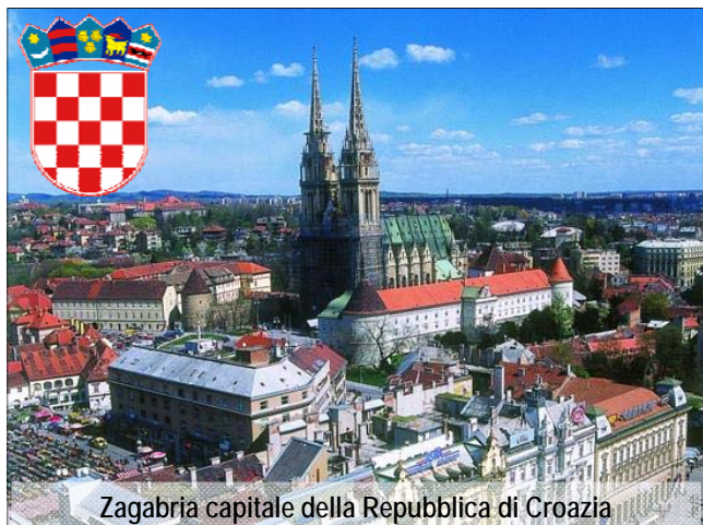
Zagabria capitale della Repubblica di Croazia