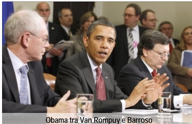
Obama tra Van Rompuy e Barroso