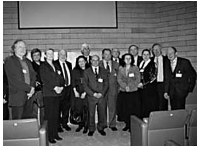
Foto di famiglia del Consiglio direttivo AJE